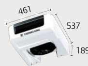
ES100N Ultra Slim