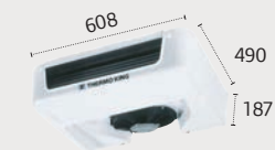
ES100 Ultra Slim